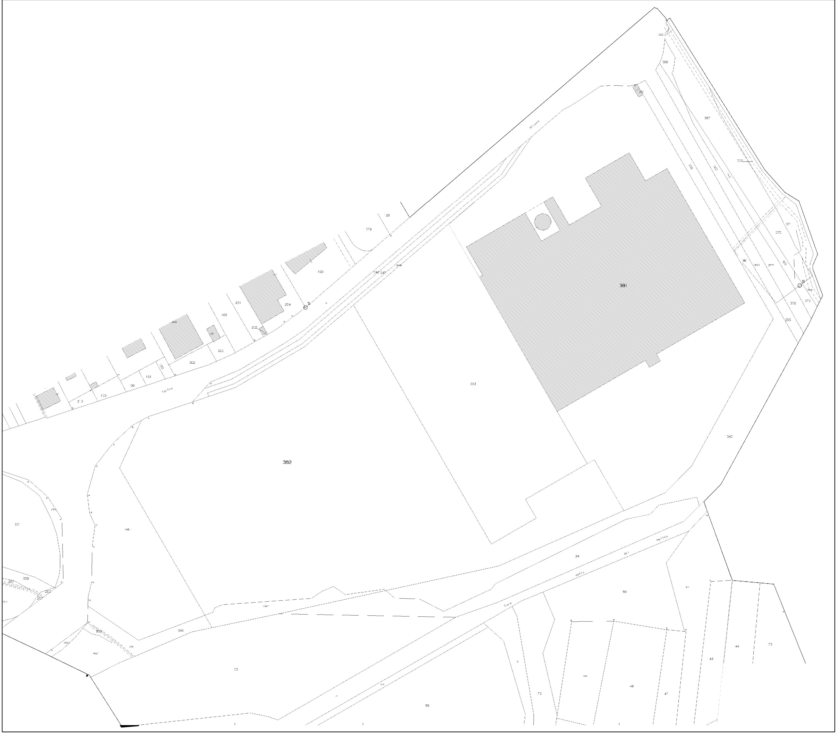
ESTRATTO DI MAPPA - SCALA 1:1500